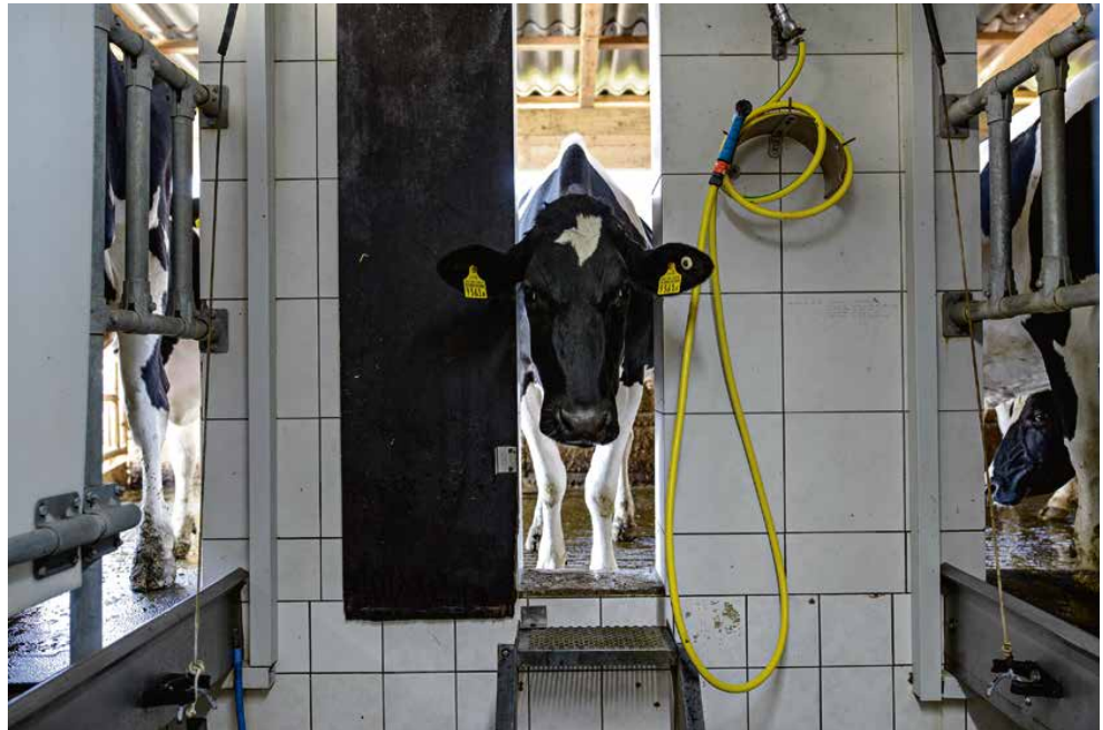
AGRICULTURE Le 13 juin, nous voterons sur deux objets liés à l'usage de pesticides. Ces textes sont quelquefois décrits comme le produit de la méconnaissance des citadins à l'égard du monde paysan. Un de nos journalistes est allé goûter à la réalité agricole, dans la ferme de la famille Chèvre, à Mettembert (JU).